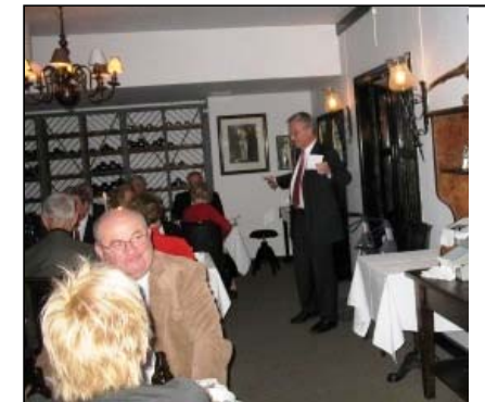
Willy leser "Se oftere mot nord" av Roy Jacobsen. Boknafiskaften. 24.11.07