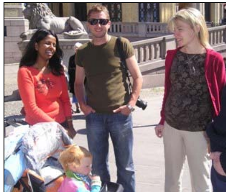
Hun t.v skal til Finnmark som Turnuslege. Flotte ungdommer