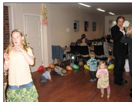
Festen er i gang.