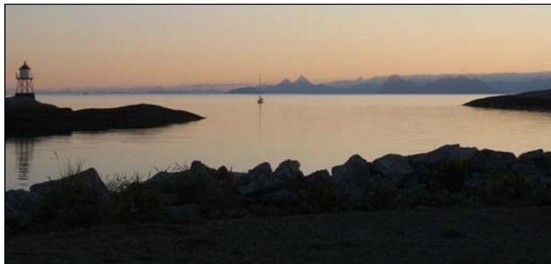
Hamsuns trolske Hamarøy.

I tillegg til alt dette er flere internasjonale arrangement og mange andre arrangement rundt i Norge. Jubileumsåret 2009 har fått sin egen hjemmeside: www.hamsun.no For de som er interessert kan Hamsun-selskapet Hamarøy gi informasjon. Tlf 75 77 23 50.