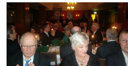
Fra bordet Torskaften 2009