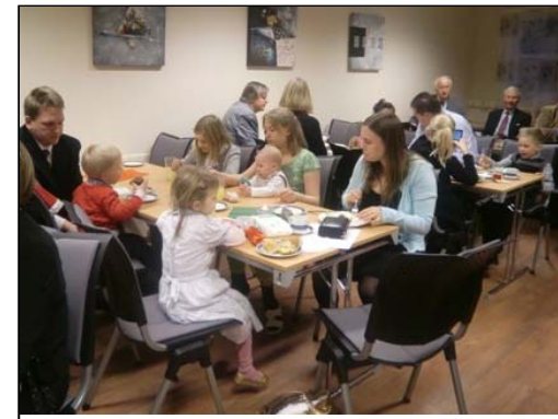
God stemning på juletreffesten.