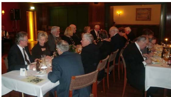
Torskaften 7. mars 2009. Fra bordet.