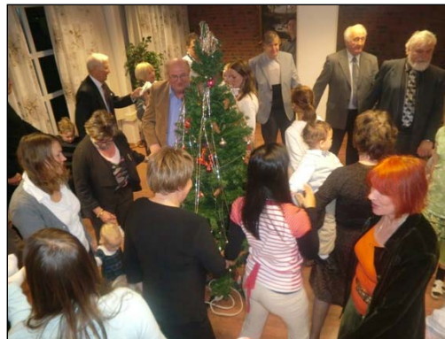
Juletreffest 4. jan 2009.