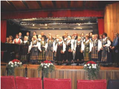
Konsert med Norwegian Celebration Choire

Nordlendingernes Forenings Kor dro 21. mai til Budapest sammen med Kisa-koret fra Ullensaker. Turen skulle være en jubileumstur, der Kisa-koret feiret 85, mens Nordlendingernes Forenings Kor feiret 65 år. Korene ble derfor samlet under navnet Norwegian Celebration Choire.