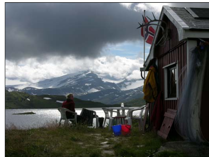
Fjellro på hytta med utsikt over Øvre Navervann med Svartisen og Middagstuva i bakgrunnen den 14. august 2004. Datter Anette koser seg i den vakre naturen med utsikt.