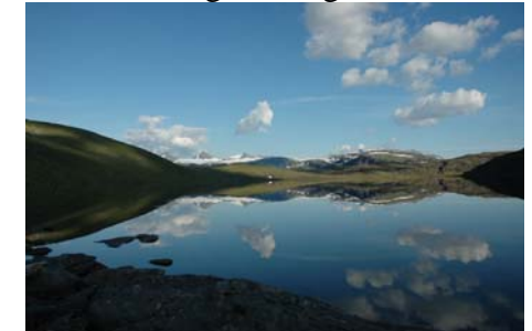
Okstindene