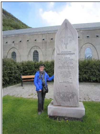
Minnesmerke Operasjon Muskedunder.

Min venninne Ragnhild og jeg ville på tur til Glomfjord. Målet var den tøffe Fykantrappen til toppen av fjellet for å nyte utsikta. Vi kom bare til hengebrua Fykantrappa blir senere i sommer På veien dit så vi oss rundt alle steder. Ved Glomfjord Kraftverk står minnesmerket over Operasjon Muskedunder sept 1942 de alliertes sabotasjeaksjon for å stoppe okupasjonsmaktens produksjon av aluminium.