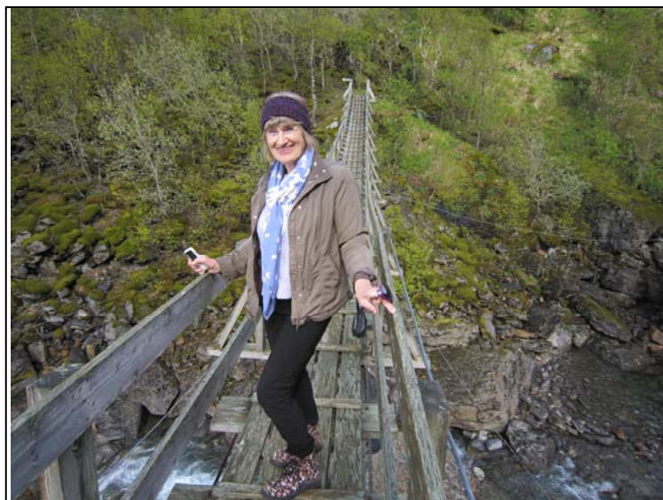
Hengebrua, på vei til Fykantrappa.

En veldig dramatisk aksjon, med tap av flere menneskeliv. En fin tur. Vi kommer igjen. 30.06.2015. Rigmor Eidem