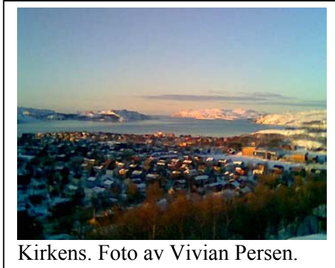
Kirkens. Foto av Vivian Persen.

Pkt.1 i innkallingen var dermed vedtatt.