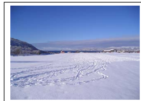
Gaunes 18. mars 2007.

Nye skispor i nattgammel snø Solrødna i horisonten Havet som ei blå strime langt der ute. Husan under toppen Og en blå, blå marshimmel over. En ny dag i nord.