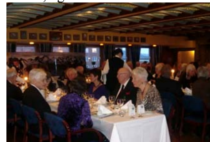
Fra middagen i Shippingklubben