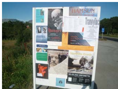
Program ifbm åpningen av Hamsunsenteret 4.08.2009