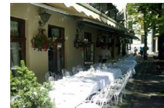
Engebret, Oslos eldste restaurant