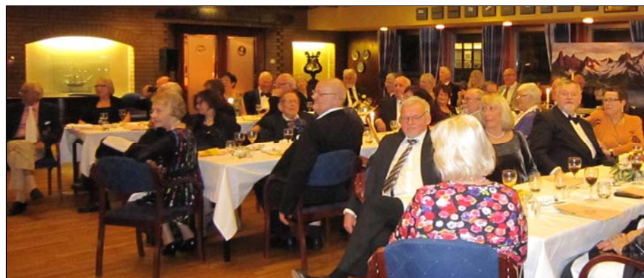
Torskaften 10 mars 2012. Fra bordet.