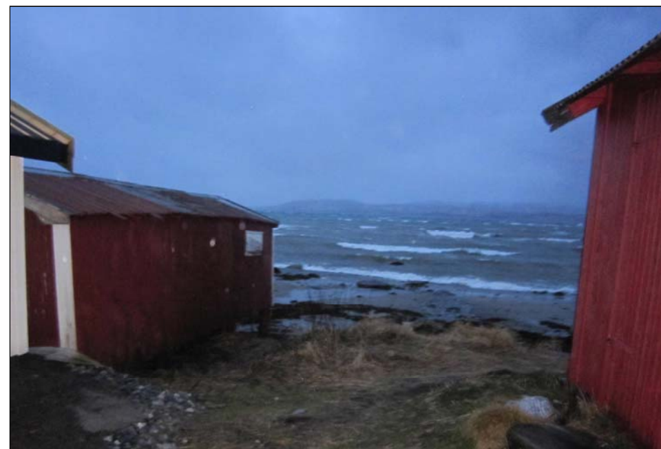
Storm over Gaunesvika