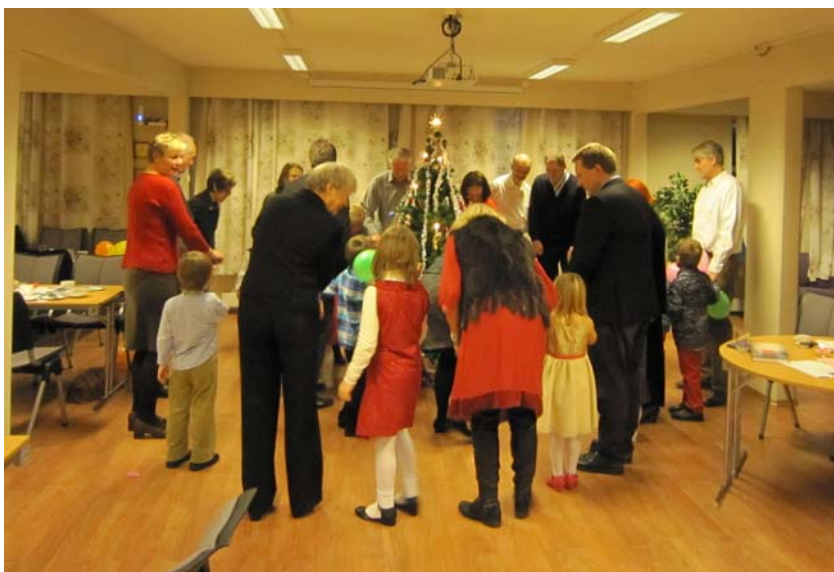
Juletefesten 2013, gang rundt juletreet.