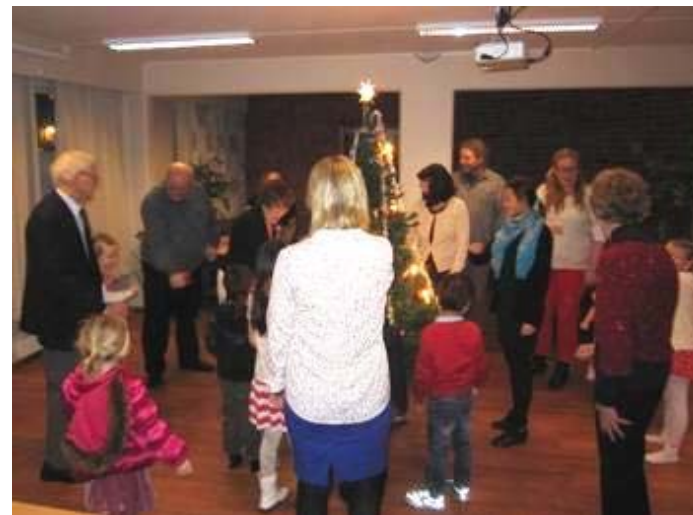
Julerefest søndag 5. januar 2014. God stemning.

Da ble en flott kveld avsluttet med ønske om en like vellykket sammenkomst neste år. Og hvilket inntrykk har en debutant fra sin første torskeaften i NF's regi? Med en liten bibelsk omskrivelse kan det kort sies: "Jeg kom til mine egne og jeg kjente dem". Opplevd av Tore Bjørkan. Oslo, 26.3.2014